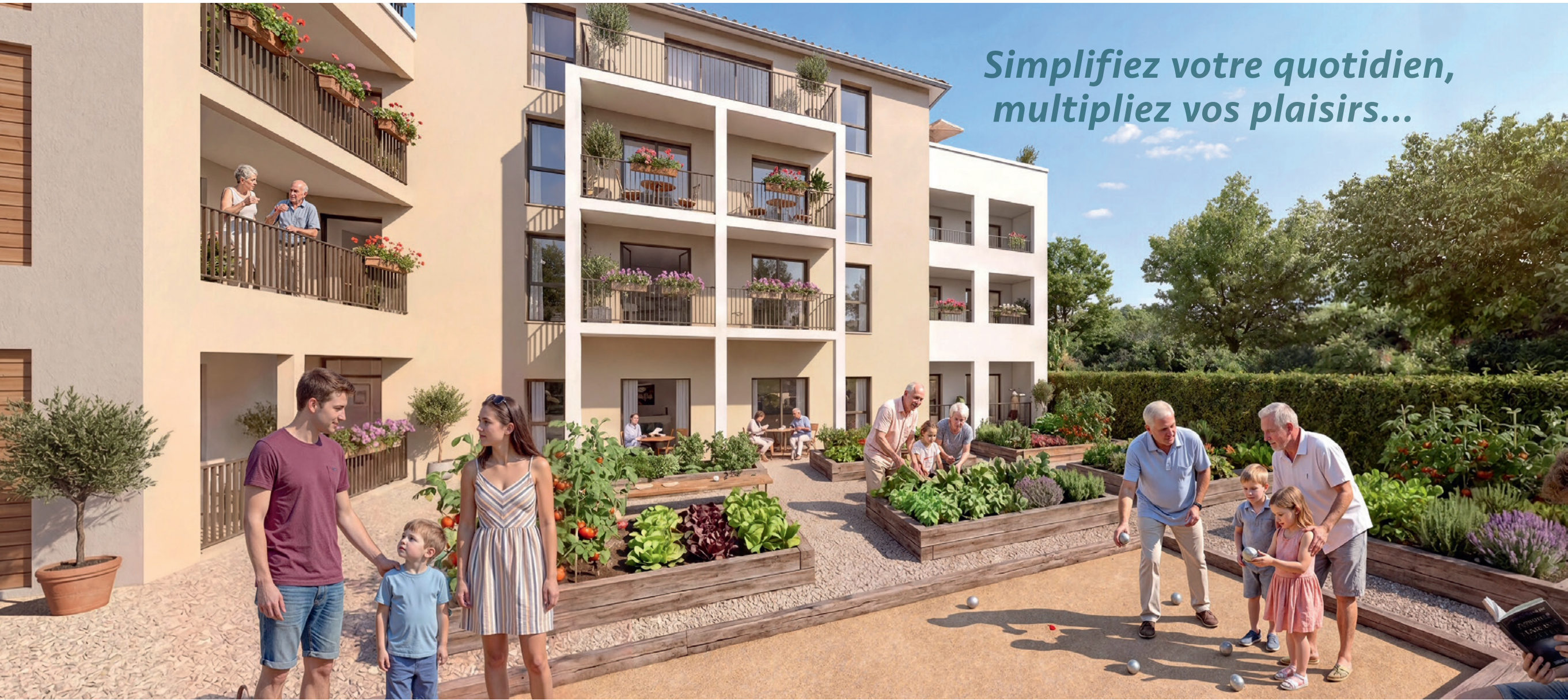
SALLE DE CONVIVIALITÉ